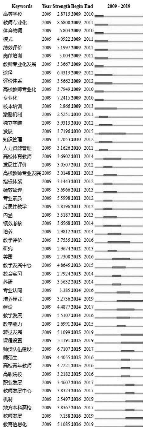
图3 Top 50 Keywords with the Strongest Citation Bursts